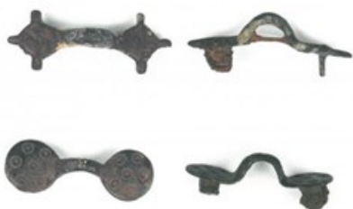
Bronzen mantelspelden (7 de -8 ste eeuw) uit De Panne (uit Lehouck A. en Thoen H., De oude bewoning..., in: Berquin H. (2012). In het zand geschreven... (www.vliz.be/hisgiskust))

We gaan in deze lezing in de eerste plaats in op de bijdrage van metaal(detectie)vondsten in dit verhaal. Hoe lichten kledij-accessoires en andere metalen voorwerpen archeologen in over de vroege bewoners van de kustvlakte en hun levenswijze? Welke rol speelden deze voorwerpen in het creëren van een eigen identiteit?