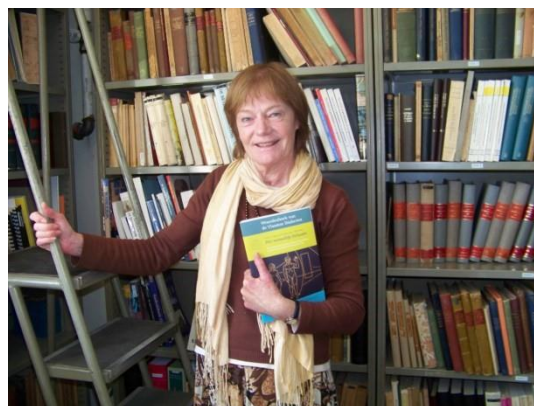
Nederlandse dialecten in Nederland, Vlaanderen en Frans-Vlaanderen.