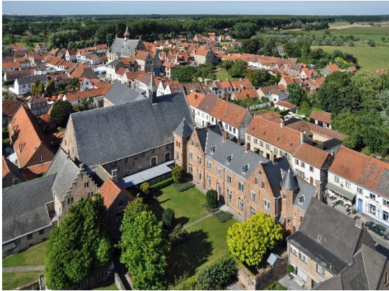
Marc Ryckaert ( MJJR ), CC BY 3.0

Via het Zwin was Brugge bereikbaar. Langs de Zwinmonding lag de stad Damme. Door die positie groeide de stad explosief. Honderden schepen passeerden. Door de verzanding van het Zwin werd de doorvaart moeilijker. Grote schepen moesten overgeladen worden naar platbodems in Damme. De pakhuizen daar bevatten onder meer wijn, peper, zilver, huiden.